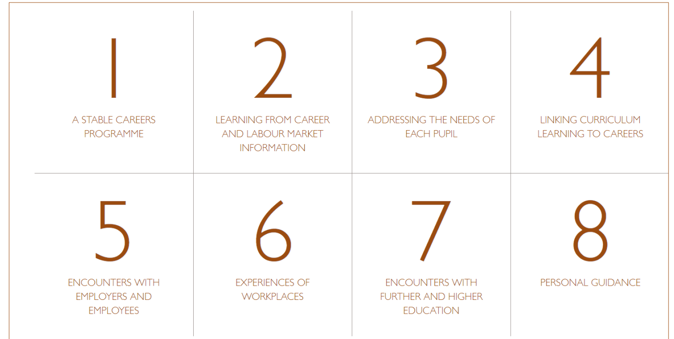
Los 8 Benchmarks de orientación profesional